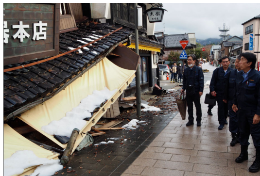
【震災直後の輪島市】 【豪雨被害を受けた仮設工房】