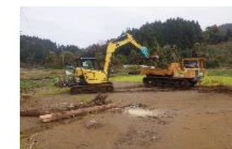
農地の堆積土砂・流木の撤去