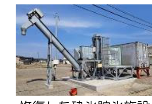
修復した砕氷貯水施設