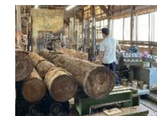
製材工場の復旧・再開