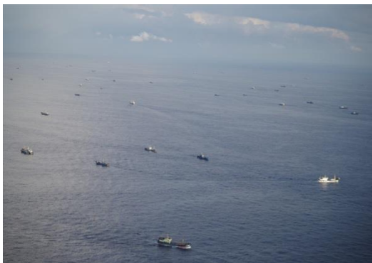
い集する漁船の状況

なお、尖閣諸島周辺の接続水域に通常展開している中国公船（3 隻程度）及び南シナ海のスカボロー礁周辺に通常展開している中国公船（4～5 隻と言われる）に比しても、現在尖閣諸島周辺には、はるかに多くの中国公船が展開している。