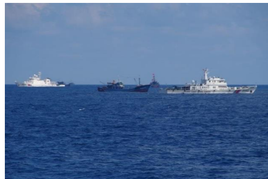
中国公船と漁船の状況