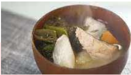
アイヌミュージアムバーチャルガイド