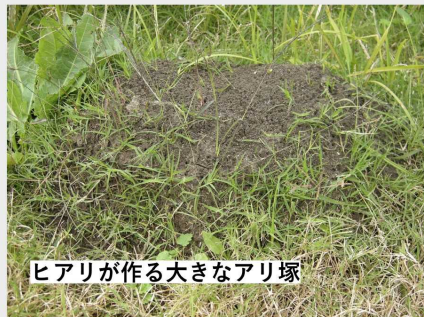
ヒアリが作る大きなアリ塚

これまで存在していなかった危険な毒アリが国内で現れています。 もし発見しても、 決して触らないでください！