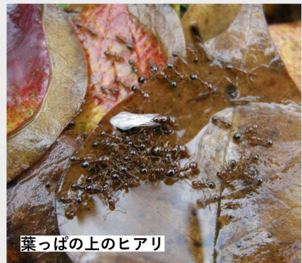
葉っぱ上のヒアリ