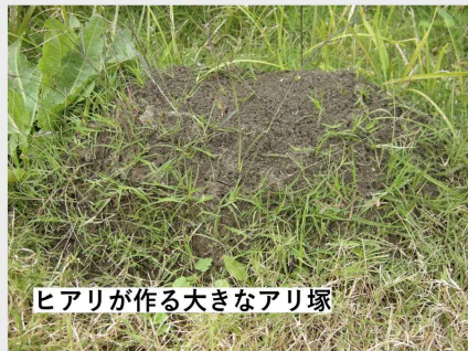
ヒアリが作る大きなアリ塚

これまで存在していなかった危険な毒アリが国内で現れています。 もし発見しても、 決して触らないでください！