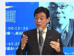
▲西村大臣挨拶（東京国際映画祭）