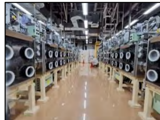
グローブボックス