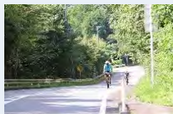
▲「スポーツ（サイクル）」WG 中山間地域のアップダウンルート