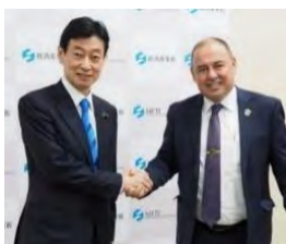
西村大臣とPIF代表団との会談(2月6日)