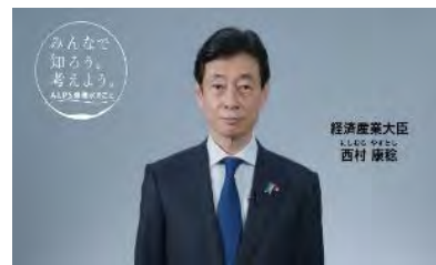
WEB動画での情報発信