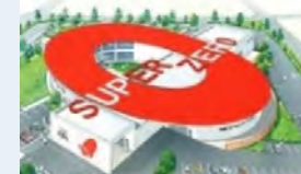
▲浅野燃糸（4/22 グランドオープン予定）

・ 双葉町の復興のシンボル として 燃糸工場「双葉スーパーゼロミル」 を建設中。