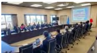
IAEAによるレビューミッションの様子