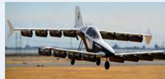
▲テトラアビエーション