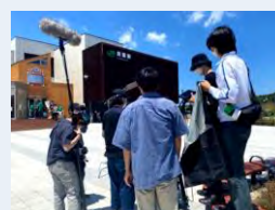
▲学生らによる撮影の様子