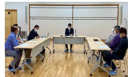
西村大臣と漁業者等との車座対話 (R4.10、R5.2に実施)