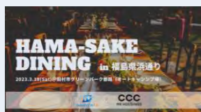
▲「酒・グルメ」WG アウトドアイベント