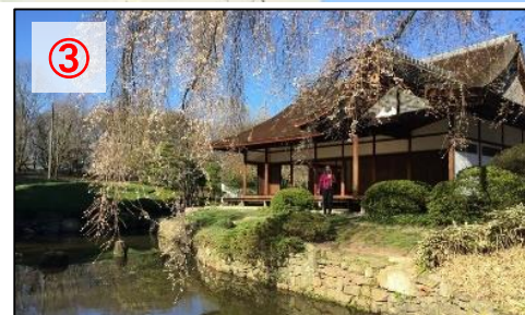
(フィラデルフィア市)