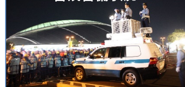
ラグビー会場周辺における警戒警備状況