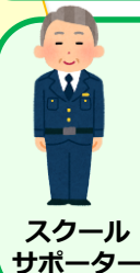
スクールサポーター