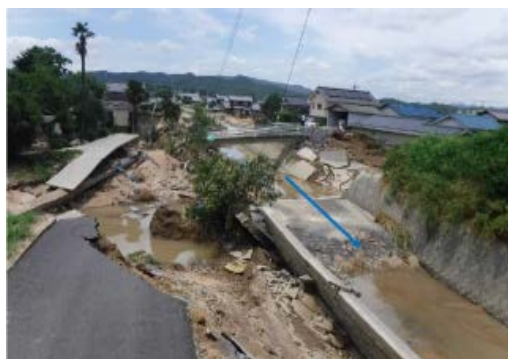
平成30年7月豪雨による被災状況(高梁川水系小田川)

○相次ぐ豪雨、地震等で、多くの尊い人命が失われ、また、重要インフラの機能に支障を来すなど国民経済や国民生活に多大な影響が発生。