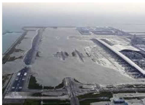
平成30年台風第21号による関西国際空港の被害状況