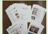
同社の業務マニュアル