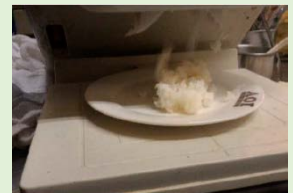
シャリ弁ロボット