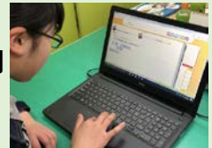
「すらら」で学習する生徒