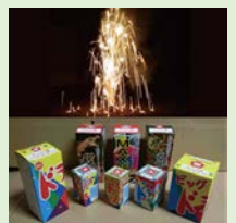
ドラゴンシリーズ