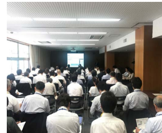
セミナー風景 （平成30年6月名古屋会場）