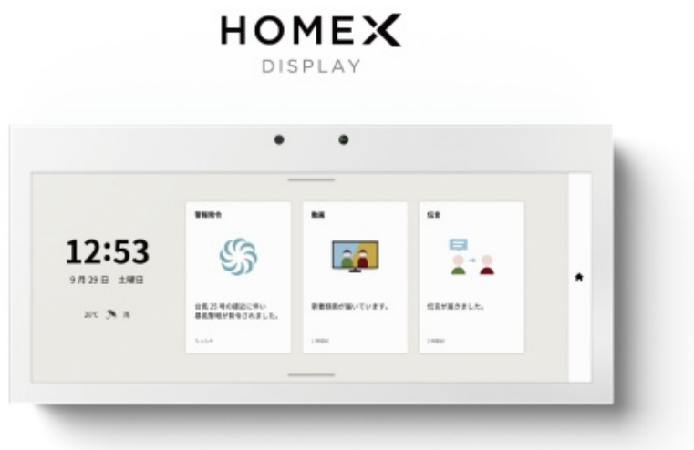
HomeX Display のイメージ

HomeX Display は、HomeX プラットフォームに対応した無線 LAN やセンサを搭載したタッチスクリーン型ディスプレイです。住空間の HomeX 対応機器と体験を美しく統合し、家族が集う場所にオムニチャンネルとして配置できます。住むほどに新しい機能が届き、より良い毎日を提供します。