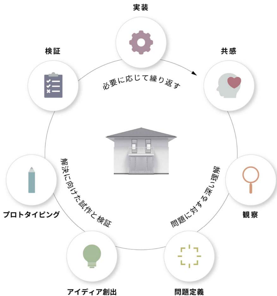
デザインシンキングのプロセスサイクル