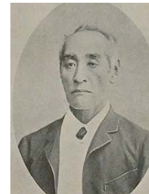
杉 亨二 (初代統計局長)

○統計資料館において、我が国の近代統計の礎を築いた先人の偉業に関する資料を展示予定。