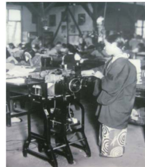
高速度群穿孔機を操作する女性職員