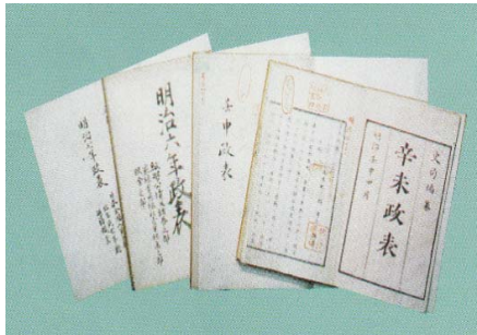
にほんせいひょう 【日本政表等】

我が国最初の総合統計書。明治5年に「辛未政表（しんびせいひょう）」（明治4年分）として刊行。