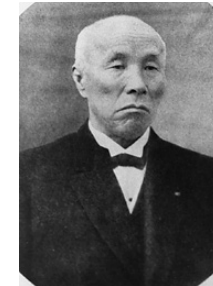
大隈 重信 (統計院の設立を建議)