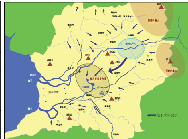
計画対象地域(地下水盆を共有する熊本地域 (熊本市を含む周辺11市町村))