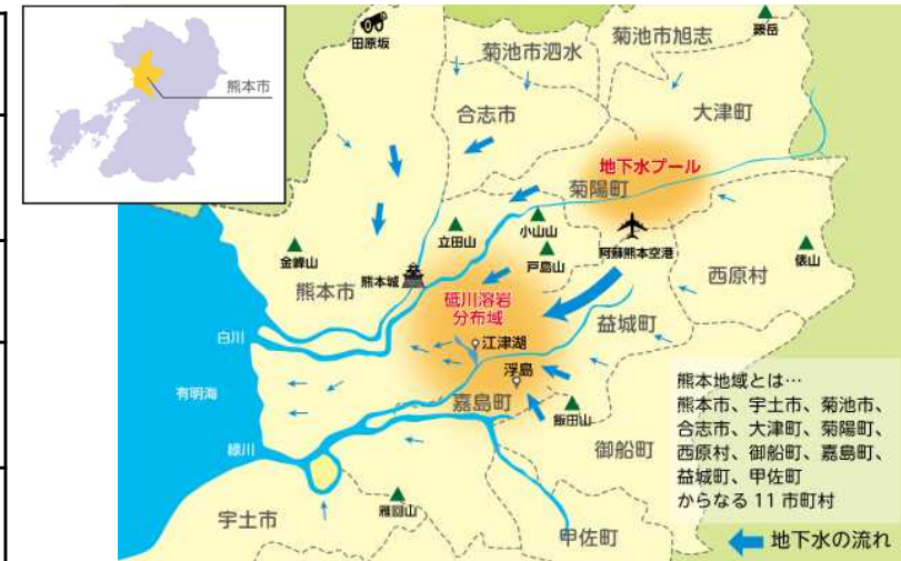
計画対象地域（地下水盆を共有する熊本地域（熊本市を含む近隣11市町村）全域）