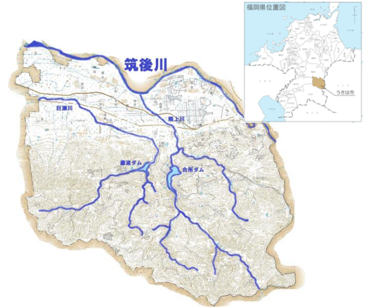
計画対象地域（うきは市全域）