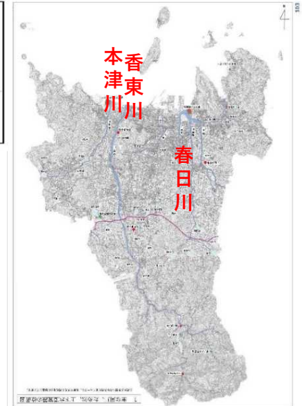
計画対象地域（香東川ほか高松市内の河川）