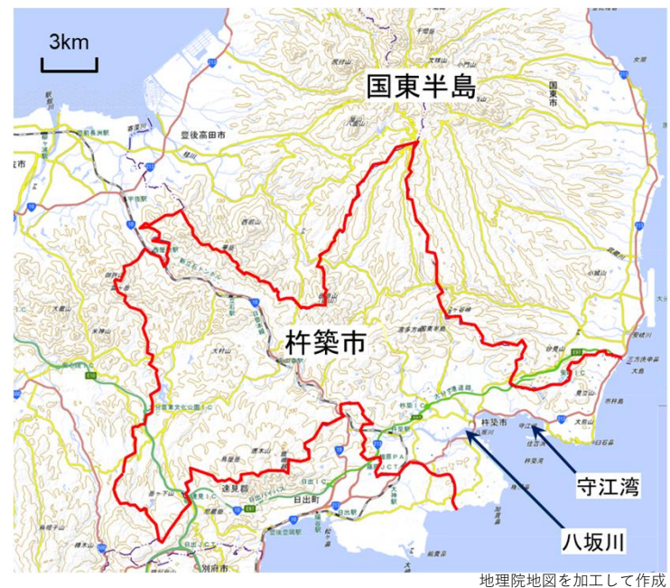
計画対象地域（杵築市全域）