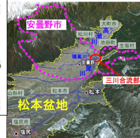
計画対象地域(松本盆地(安曇野市内のみ))