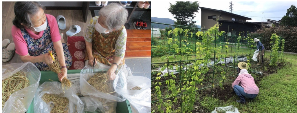
認知症のある人たちが、自分たちでホップを栽培