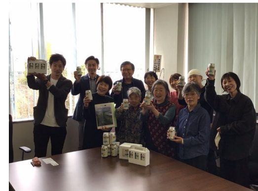
ビールをつくって、市長に届けました（長野県諏訪市）