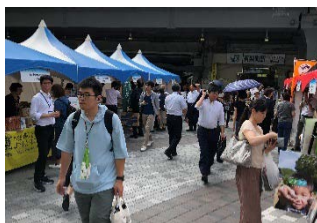
選定地区（10地区）による マルシェの様子 （@有楽町 来場者約7,500名）

都内においてシンポジウム（2018年7月）や選定証授与式・交流会（2018年11月）の開催に合わせ、「ディスカバー農山漁村の宝」及び選定地区について広く情報発信するためのマルシェを開催。選定地区が出展し、来場者に直接オススメ商品や取組の紹介を行った。また、交流会の動画も放映しPRを実施。