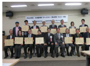
九州ブロックでの 選定証授与式の様子 （2018.12@九州農政局）