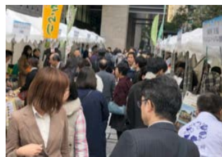
第5回選定地区（26地区）による 交流会翌日のマルシェの様子 （@日本橋 来場者約4,500名）