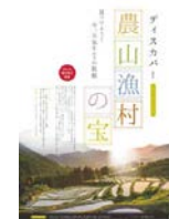
ポスター及び リーフレット