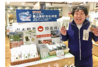
吉本興業所属芸人による 店頭でのPR販売