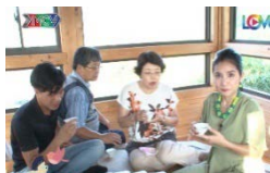
放送のキャプチャー画像