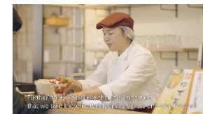
プロモーション動画 (左:日本語版 右:英語版)