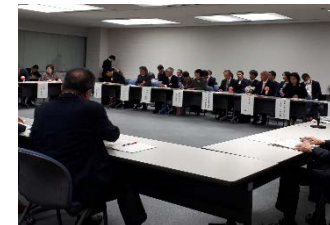
選定証授与式その他、 意見交換会も実施。 （2018.12@関東農政局）