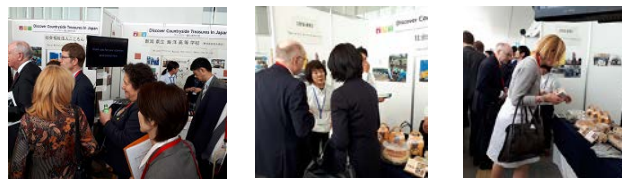
G20新潟農 相会合での 出展の様子

2019年2月にATCアジア太平洋トレードセンターにおいて開催された国産農産物・展示商談会「アグリフードEXPO」に出展。全国のバイヤーに向けて「ディスカバー農山漁村の宝」のPRとともに、選定地区の広域的な販路拡大を図った。