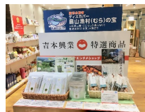
「ディスカバー農山漁村の宝」 特設コーナー

「ディスカバー農山漁村の宝」選定地区の特産品が、なんばグランド花月にある「よしもと47ご当地市場*」で販売。