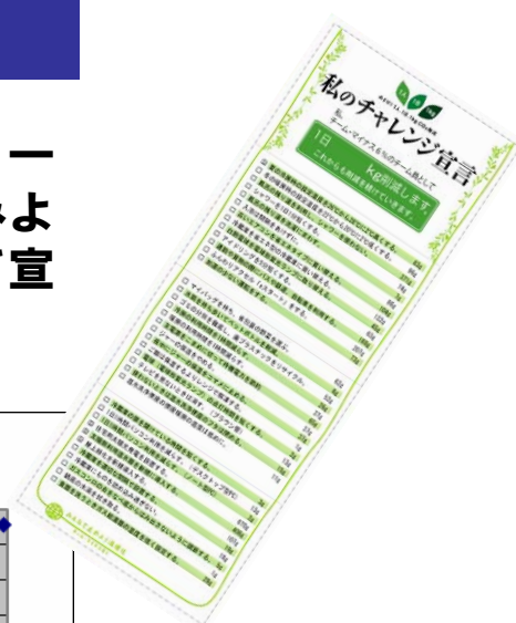
【チャレンジ宣言カード】

「1人1日1kgのCO 2 削減」に向けて、一人ひとりが、身近な取組の中から実践してみようと思うものを選択し、CO 2 削減に向けて宣言する「私のチャレンジ宣言」を実施。