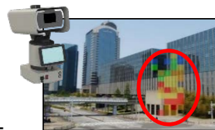
化学剤遠隔検知装置