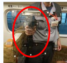
護身用具の配備 （透明盾）