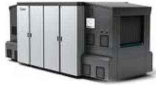
三次元X線検査装置