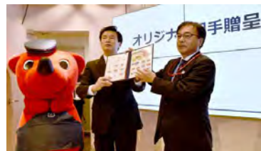
フレーム切手贈呈式の様様