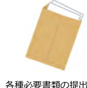
各種必要書類の提出