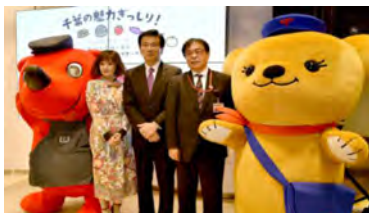
オープニングイベントの様様

JR東京駅前の「KITTE」地下1階に千葉県アンテナショップをオープン。※開催期間：2017年11月18日～12月16日 日本郵便は、チーバくんオリジナルフレーム切手の販売や郵便局長が推薦する地元の特産品の販売を実施しました。