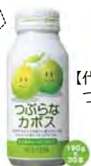
【代表例】 つぶらなカボス

「郵便局のネットショップ」への掲載によるお礼の品事業者様への販売支援も可能です。