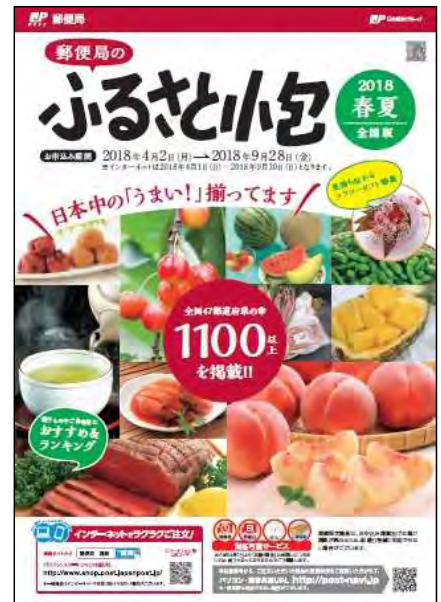
ふるさと小包全国版カタログ