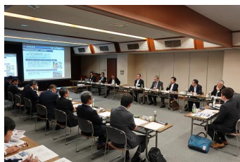
ディスカッションの様子