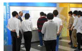
企業バスツアーの様子 (松阪市主催)