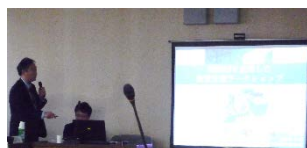
市職員による発表の様子