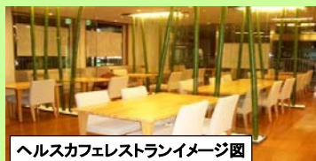
ヘルスカフェレストランイメージ図

高齢者向け住宅、ヘルスカフェレストラン等の商業施設及び多目的ホールを兼ね備えた複合施設を整備することにより、高齢化率の上昇とともに商店街の老朽化が顕著となっている中心市街地に対し、利便性の向上及び賑わいの創出を推進する。