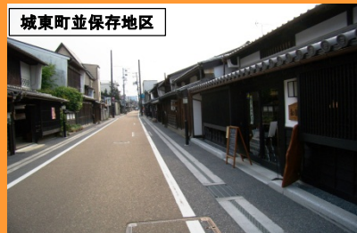
城東町並保存地区