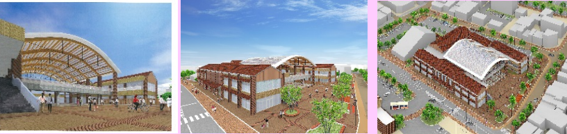
公共公益複合施設イメージパース

JR江津駅前に、市民交流センター機能、総合福祉センター機能、子育て支援機能、観光案内機能を有する複合施設を整備し、子どもから高齢者まで様々な世代の交流や市民の活動の場を創出