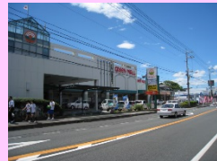
商業核「グリーンモール」

商業核であるグリーンモール内の空き区画を活用した高齢者サロンの提供や島根県内特産品のアンテナショップの整備など、店舗再編や店舗動線などのリニューアルを実施