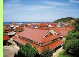
石州赤瓦のまちなみ

駅前地区ゾーンにおいて、屋根の実面積が30㎡以上となる建築物の新築、増築、大規模修繕の際に石州赤瓦の資材費の一部を助成し、まちなみ景観を保全