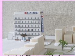
宿泊施設イメージパース

中心市街地内に不足している宿泊施設を充実させるため、6階建て71室の宿泊施設を建設