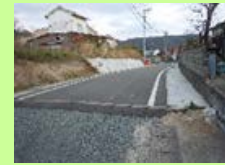
東高浜地区の道路整備例