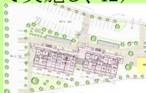
中心市街地共同住宅整備イメージ