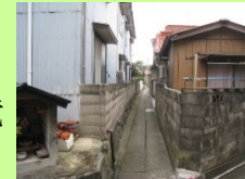
東高浜地区の狭隘道路の状況

JR江津駅に隣接している密集市街地の東高浜地区において、道路整備等を行いながら、良好な居住環境の整備を段階的に実施