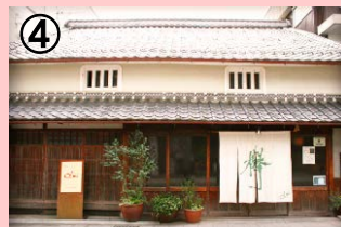
㈱まちづくり柏原が経営するレストラン「オルモ」

㈱まちづくり柏原が主体となって取り組んでいる中心市街地内の空家・空地を活用したテナントミックス事業を引き続き実施する。