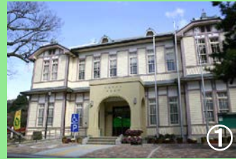
観光機能を充実する柏原支所