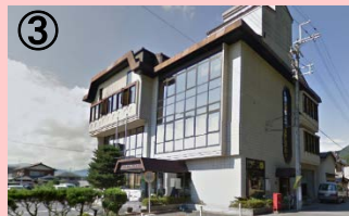
旧柏原町商工会館

旧柏原町商工会跡を、シェアオフィスなどインキュベーション施設としてリノベーションを行う。起業者支援拠点として、相談窓口機能を充実させるほか、専門家による支援を実施するなど、起業者のワンストップサービスの拠点として充実を図る