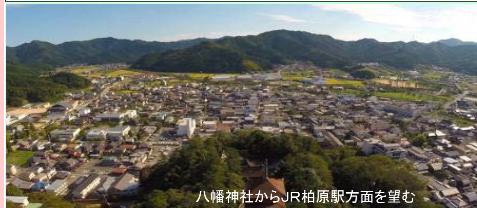
八幡神社からJR柏原駅方面を望む