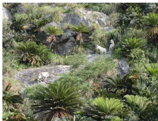
同地区に生息するノヤギ