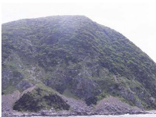
今井崎（食害による崩落）