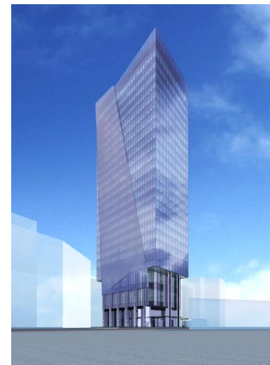
ビジネスと生活環境の一体的な整備