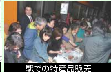
駅での特産品販売