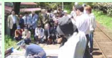
サポーターズクラブによる 駅名標作成