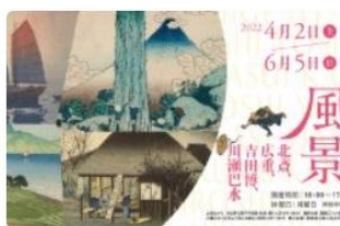
旅路の風景—北斎、広重、吉田博、川瀬巴水—(2022/4/2-6/5) オンライン展覧会

https://jpsearch.go.jp/gallery/okinawa_nanjo-ZIMMdZvm0wv