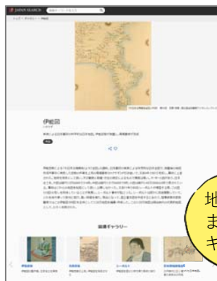
「伊能図」のギャラリー