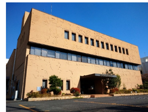
福岡市埋蔵文化財センター