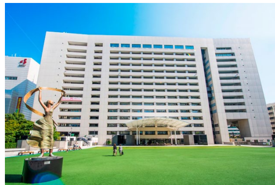
福岡市文化財活用課