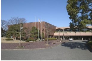
福岡市美術館 所蔵品検索