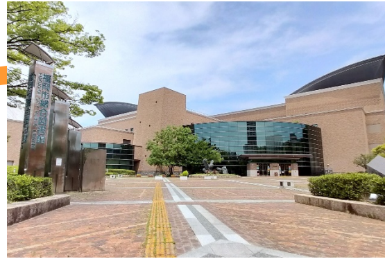
福岡市総合図書館