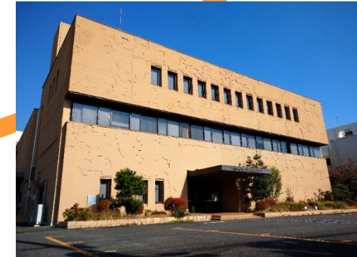
福岡市埋蔵文化財センター