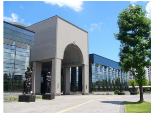
福岡市博物館 収蔵品データベース