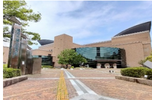
福岡市総合図書館 古文書資料収蔵品データベース