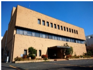
福岡市埋蔵文化財センター 3D画像