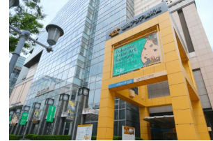
福岡アジア美術館 所蔵品検索