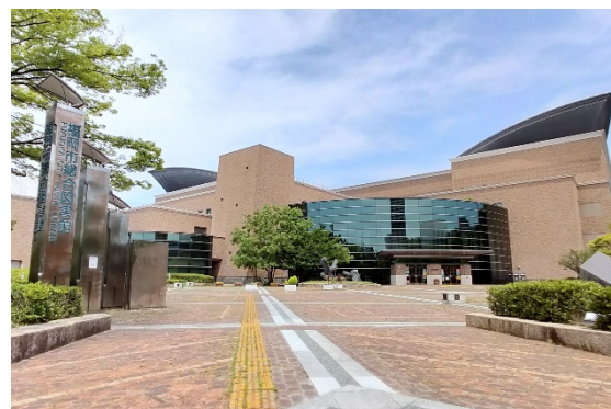
福岡市総合図書館