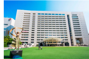
福岡市文化財活用課/埋蔵文化財課 文化財情報検索 埋蔵文化財包蔵地図