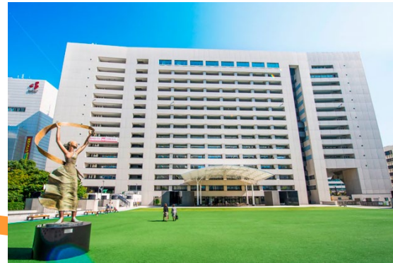
福岡市文化財活用課 埋蔵文化財課