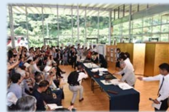
●書道交流展の開催