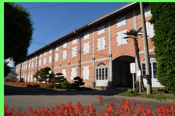
世界遺産・富岡製糸場