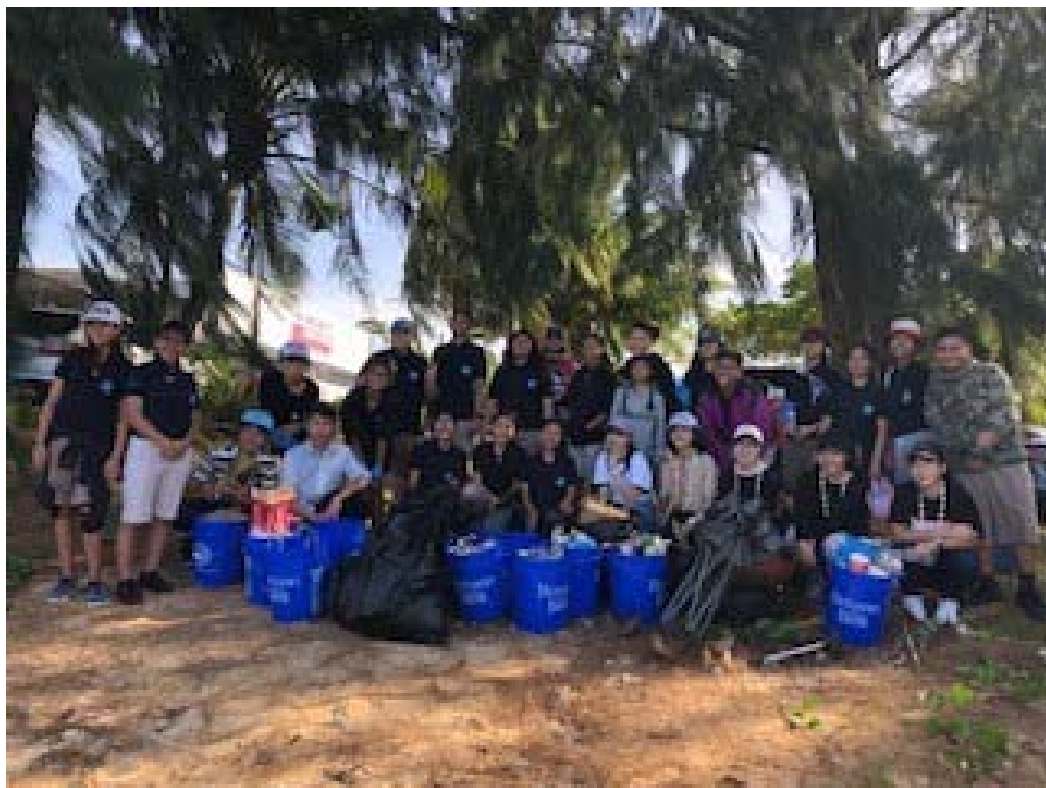
(福岡県柳川市、みやま市、みやこ町、築上町とグアムの中学生による グアムのアガニヤ湾でのごみ拾い 2020年1月)