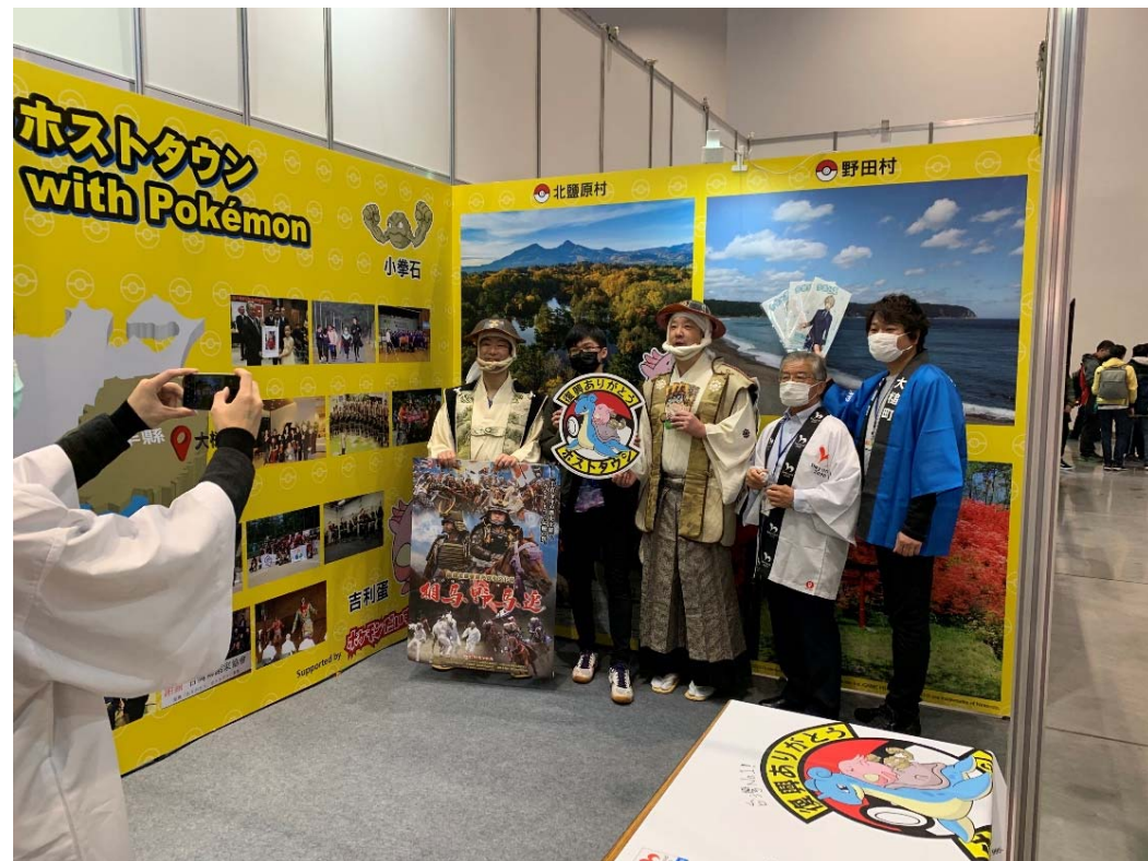
(岩手県大槌町、野田村、福島県南相馬市、北塩原村による 台北国際動漫節（日本館）への出展 2020年1,2月)