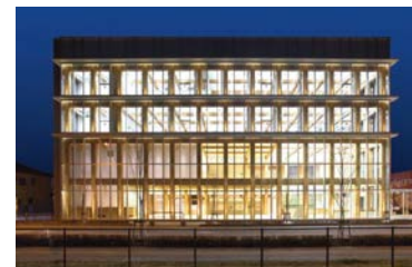
鋼材を内蔵した集成材