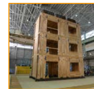
CLTを利用した建築物の実大振動台実験