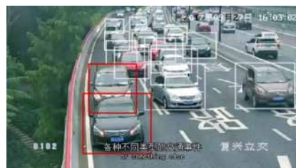
交通状況 自動判別の様子