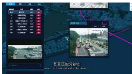
交通管制センター リアルタイムモニタリング