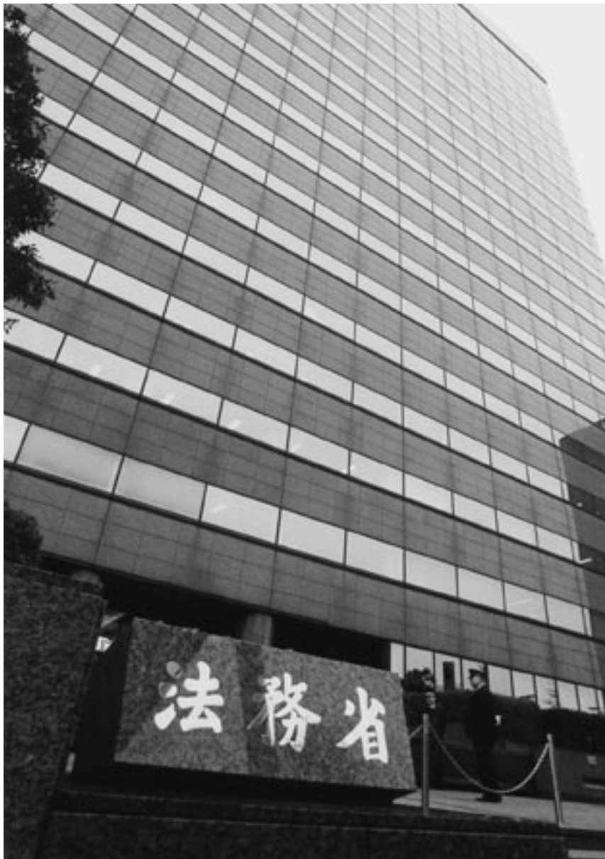
法務省の庁舎（合同庁舎六号館）