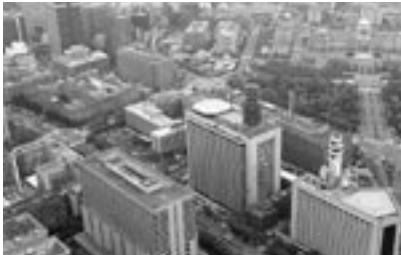
日比谷上空から霞が関の官庁街を望む。右上上には国会議事堂が見える