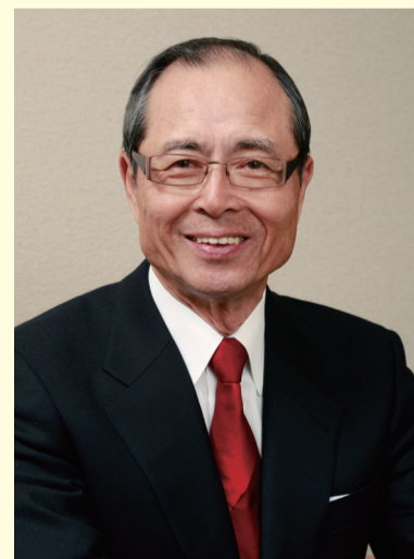
福岡ソフトバンクホークス会長 王 貞治

一人ひとりの力は小さくても、皆で心を合わせ、力を合わせ、一步一步足を踏み出していけば、必ずや日本のよさを取り戻せると信じています。被災地復興のため、そして力強い日本を取り戻すため、前を向いて進んでいきましょう。